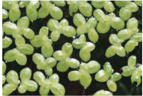
5. アオウキクサ Lemna aoukikusa subsp. aoukikusa 筑波実験植物園 16.8.31 (田中法生)→p.107