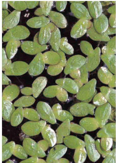
2. ヒメウキクサ Landoltia punctata 東京都町田市 95.8.25 (木原)→p.107