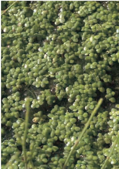
2. ヒメウキクサ Landoltia punctata 千葉県我孫子市 01.11.18 (山田)→p.107